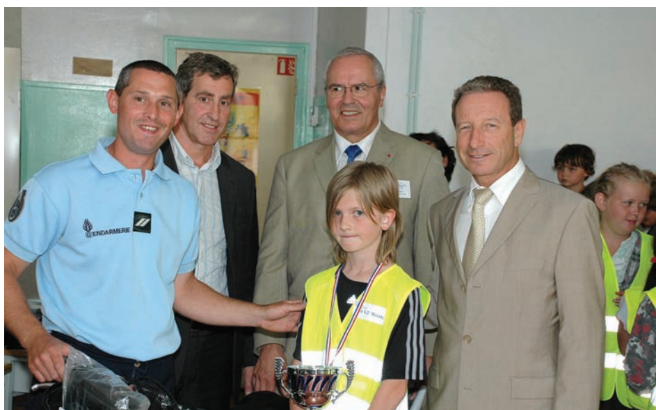
La prévention routière est l'un des axes de la politique de sécurité. Ci-dessus, la remise des prix du challenge départemental de la prévention routière, le 16 juin à l'école du Plume Vert.