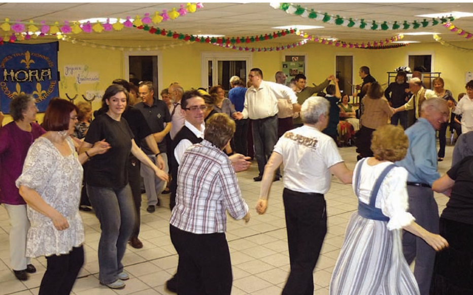
Une soirée anniversaire placée sous le signe des retrouvailles.