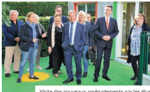
Visite des nouveaux aménagements par les élus

précédant la phase technique ont été menés conjointement avec les acteurs concernés. Cette réalisation a été financée à 60 % par la Caisse des Allocations Familiales de Seine-et-Marne dont la contribution majeure a permis l'aboutissement de ce dossier. Dès le 1 er septembre prochain, les premiers bambins entourés du nouveau personnel vont s'approprier ces nouveaux locaux.