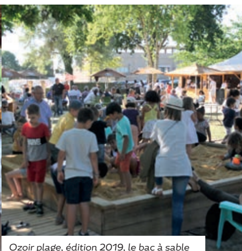
Ozoir plage, édition 2019, le bac à sable fait la joie des très jeunes enfants