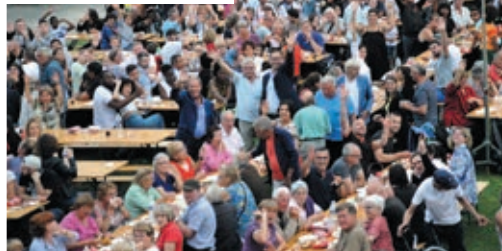
ACTUS / 21 TOUS LES OZOIRIENS ÉTAIENT EN FÊTE!