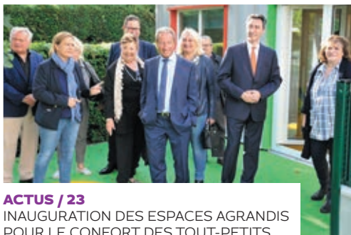
ACTUS / 23 INAUGURATION DES ESPACES AGRANDIS POUR LE CONFORT DES TOUT-PETITS