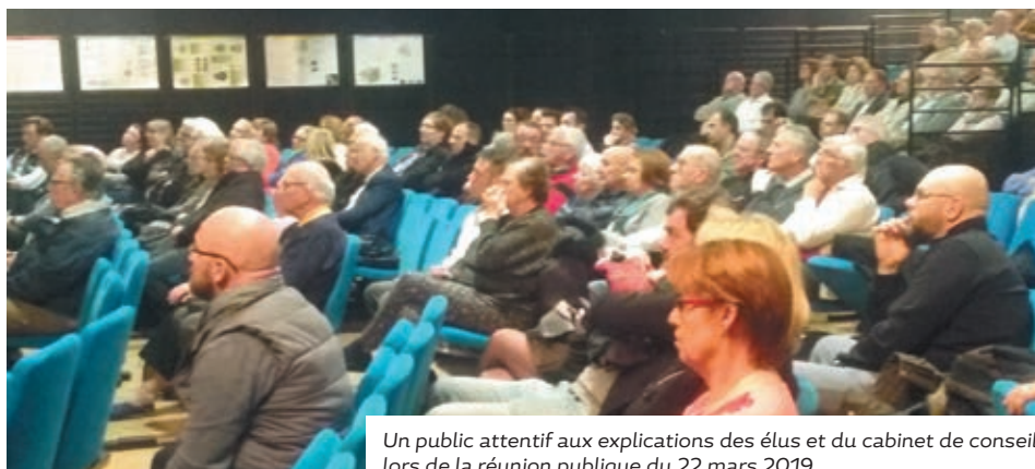
Un public attentif aux explications des élus et du cabinet de conseil lors de la réunion publique du 22 mars 2019

■ Les annexes, avec notamment les servitudes d'utilité publique et les annexes sanitaires.