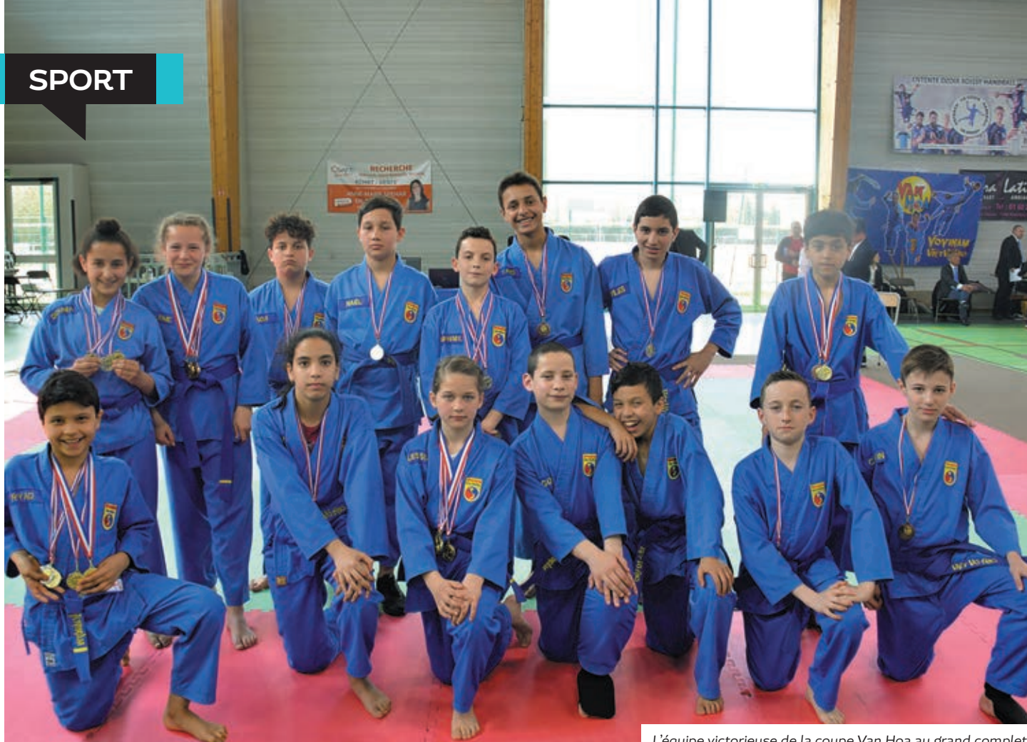
L'équipe victorieuse de la coupe Van Hoa au grand complet