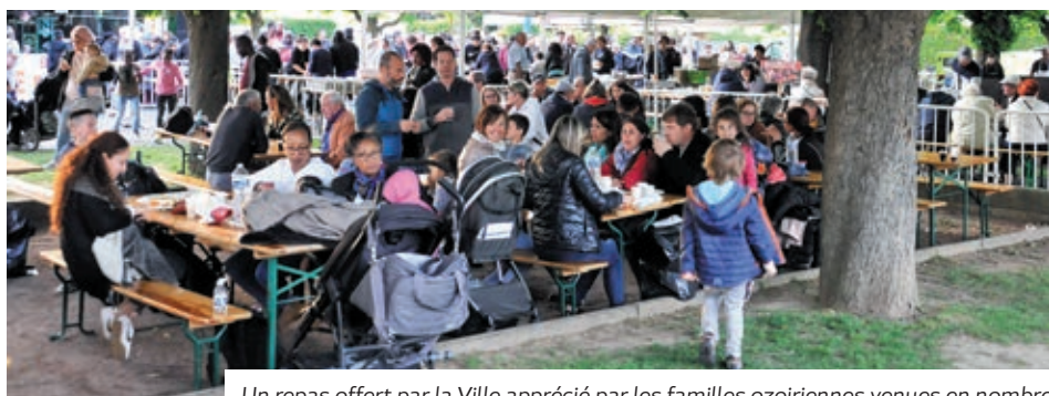
Un repas offert par la Ville apprécié par les familles ozoiriennes venues en nombre