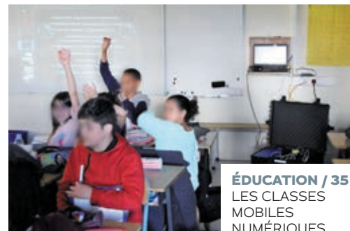
ÉDUCATION / 35 LES CLASSES MOBILES NUMÉRIQUES