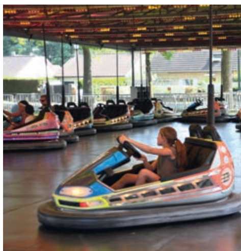
Ozoir plage, édition 2018, la fête foraine

📍 D'INFOS concernant les animations : 🐾 mairie-ozoir-la-ferriere.fr