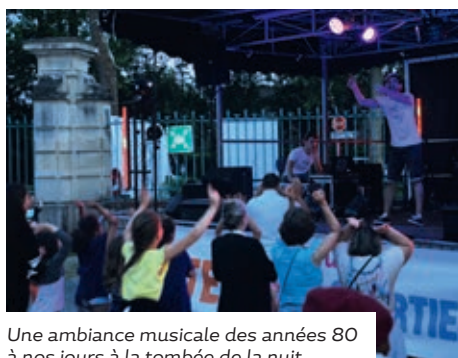
Une ambiance musicale des années 80 à nos jours à la tombée de la nuit

A u Parc Oudry, sur la Place du Marché ou encore à la Ferme Pereire, les fêtes de quartiers ont réjoui les familles ozoiriennes. Au menu : la ferme avec des animaux, les structures gonflables et un manège, les balades en poney shetlands, les animations musicales, le barbecue géant et une soirée dansante avec DJ! Retour en images.