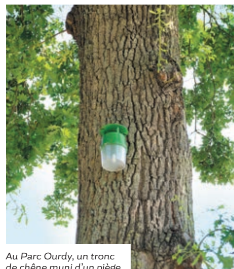
Au Parc Ourdy, un tronc de chêne muni d'un piège

sont ainsi, à l'origine de réactions cutanées. Les dégâts, qu'elles provoquent sur les végétaux qu'elles colonisent (pins, cèdres, chênes), occasionnent un affaiblissement des arbres à moyen terme. S'inscrivant dans un plan communal préventif se réitérant chaque année, la démarche municipale consiste à traiter les sujets par un traitement phytosanitaire biologique respectueux de l'homme et des animaux, tout en préservant la faune. En parallèle, des pièges à "effet