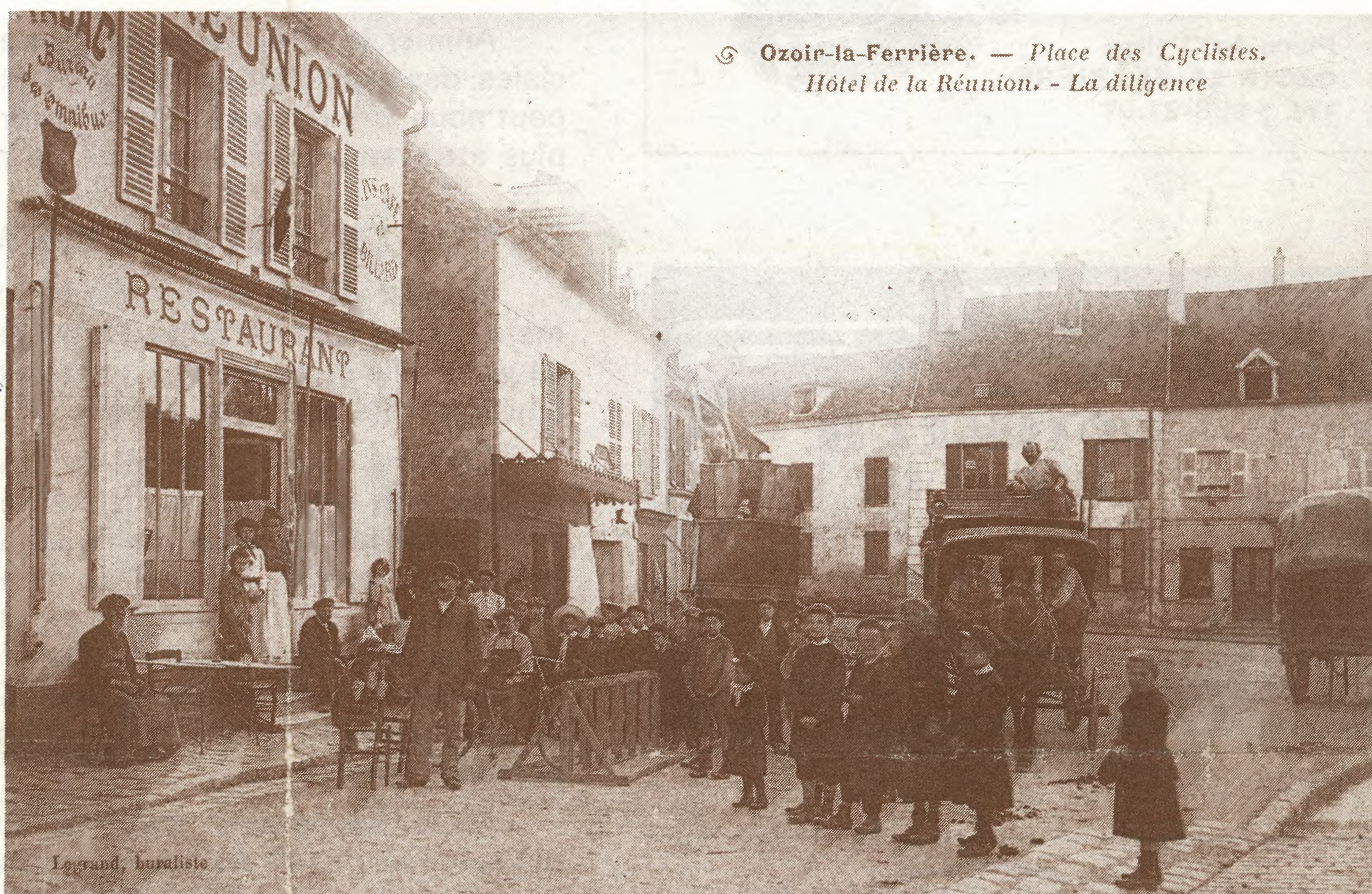
Ozoir-la-Ferrière. — Place des Cyclistes. Hôtel de la Réunion. - La diligence